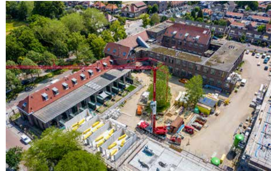
'Geen twee woningen zijn identiek'.